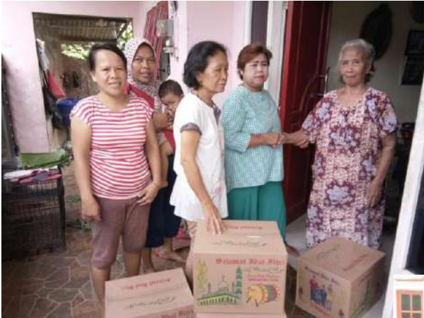
Lingkungan Sta. Angela

Di bulan Ramadan ini, Seksi Perberdayaan Sosial Ekonomi (PSE) membuat program pembagian paket Lebaran bagi saudara-saudara kita yang berkekurangan. Beberapa lingkungan dan wilayah menjadi ujung tombak program ini. Berikut beberapa potret aksi pembagian paket itu.