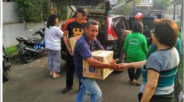
Lingkungan Sta. Yovita