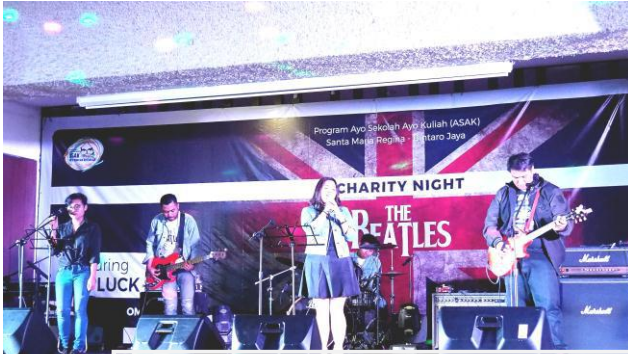
OMK Band menjadi band pembuka...

Sebagai bagian dari upaya menggalang dana untuk membiayai Program Ayo Sekolah Ayo Kuliah (ASAK), pada Sabtu, 3 Februari 2018, Gereja SanMaRe Paroki Bintaro Jaya menyelenggarakan Charity Night dengan mengambil tema The Beatles Night. Ada sekitar 200 orang hadir di acara itu. Jepretan Ary Satrio memberikan gambaran suasanaanya.